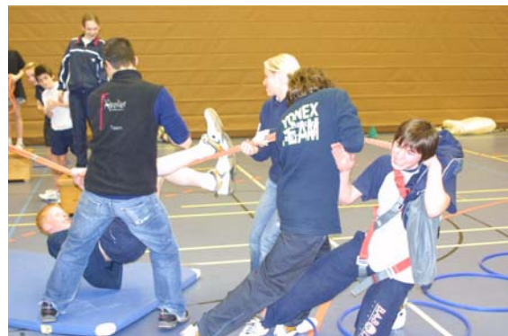
Harte Arbeit war jedenfalls auch angesagt...