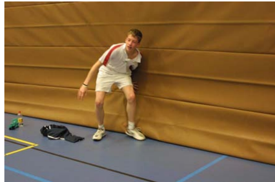
Es war zum heulen... ☺