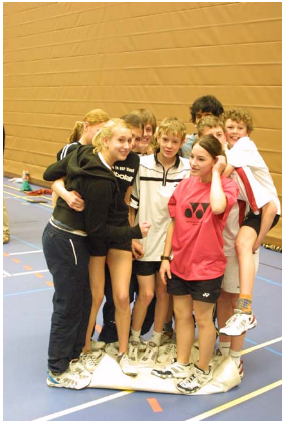
Lasst euch was einfallen, wie ihr alle Platz findet auf einer gefalteten Unterlage...

DBV-Ranglisten) sollte es etwas Großes geben. Leider passte das Wetter nicht, schließlich wollten wir draußen.... – von wegen. Das wird noch immer nicht verraten. Also waren Infoeinheiten und Teambuilding mit netten Menschen angesagt. Ganz nett, aber kein Weltniveau. Auf ein Neues im nächsten Jahr.