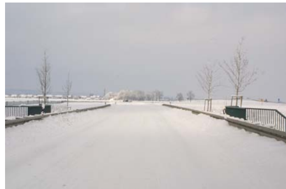
Schnee, Schnee und nochmals Schnee...

NRW außerhalb NRWs – und das gleich in Bayern. Um einen kleinen Eindruck vom Niederschlag in Bayern zu geben, dient folgendes Foto, das aber bei weitem nicht aussagen kann, wie amüsant, lange und aufregend die Hinfahrt durch Schnee und Eis war.