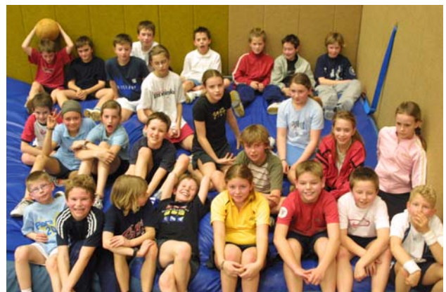
Das waren die Teilnehmer der Zentralen Sichtung. Kann sich jemand wieder erkennen?

Die ganz Kleinen trafen sich ein erstes Mal in der Südstraße. Aus allen Bezirksstützpunkten waren sie nach Mülheim geströmt, um sich mit den Besten zu vergleichen. Die Allerbesten wurden in den D1-Kader nominiert und werden noch in den nächsten Tagen ihre Informationen erhalten. Nach den Osterferien geht dann das Training für die 95er oder sogar 96er und 97er in den Landesleistungsstützpunkten los. Highlight der Sichtung war übrigens – wie immer – Takeshi's Castle.