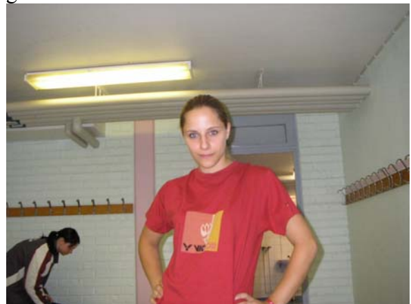
Szenen nach der Niederlage im Einzel in der Damenumkleide in Malmö – Posen wie ein Model 😊