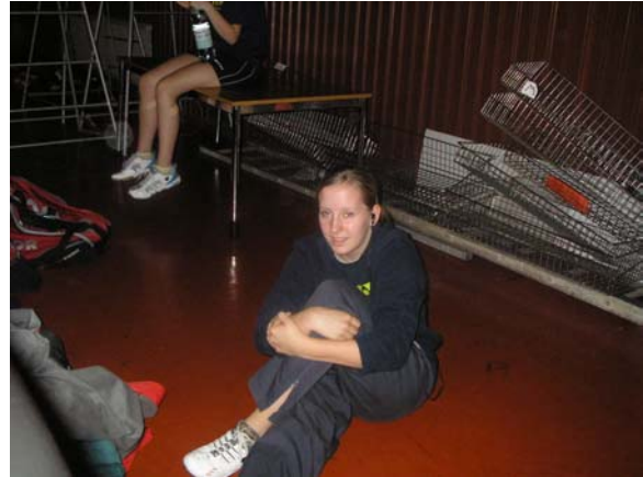
*** BRAND NEW LAURA ***

nicht nur, sondern sie zog mit ihrem Sieg gegen die an 4 gesetzte Franzi sogar ins Halbfinale ein.